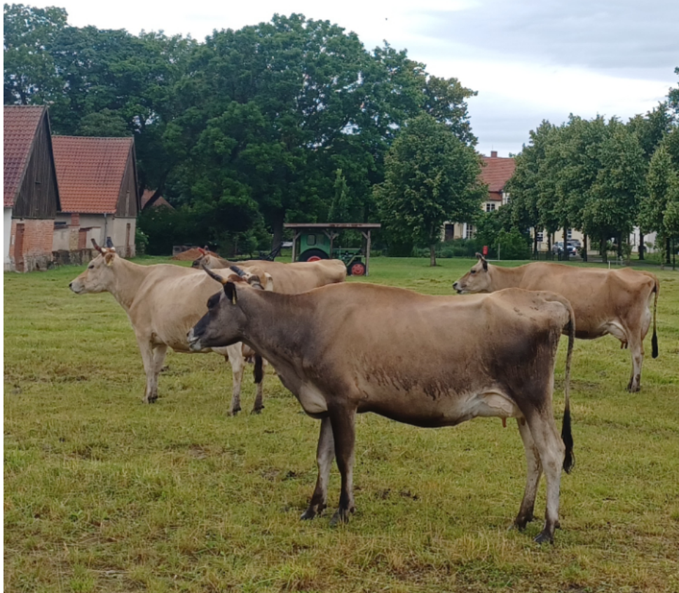
Juni 2025

Fleisch: Die Veredelungsproduktion und die Zahl der Veredelungsbetriebe (Schweine- und Geflügelhaltung) gehen insgesamt zurück. Die verbleibende Produktion konzentriert sich weiter in größeren, spezialisierten und sehr effizient geführten Betrieben.