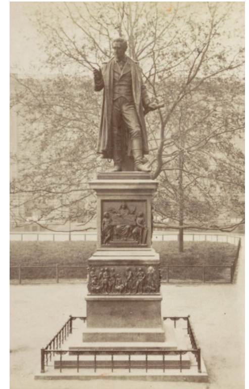
Historisches Foto vom Thaer-Denkmal um 1870.

2008 wurde der Platz offiziell eingeweiht. Die letzten Arbeiten an den Denkmälern wurden allerdings erst 2011 abgeschlossen.